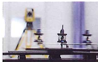
高速振動追尾テスト