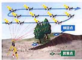
TSトラッキング UAS による測量イメージ