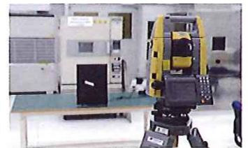
回転体追尾耐久テスト